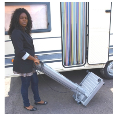
Leichtes Handling dank Rollenfahrwerk