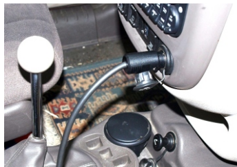
Anschluss an 12V= PKW-Speisedose (optional Spannungswandler für 24V=)