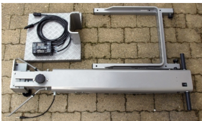
Einfach zerlegbar in 3 Hauptkomponenten, für platzsparenden Transport u. Lagerung