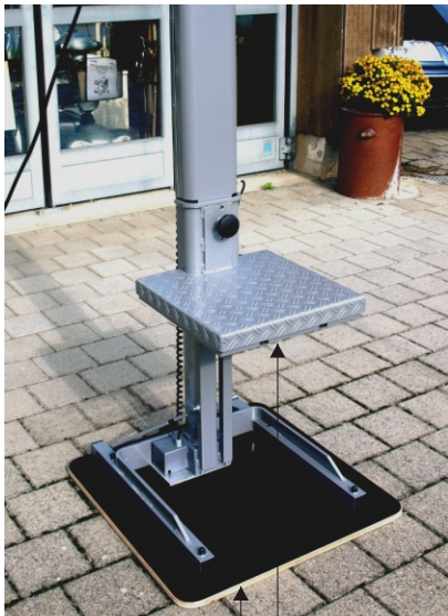
Grundplatte (optional) für verbesserte Standfestigkeit auf unebenem Boden

Handlich und kompakt, fahrbar und tragbar, ideal für unterwegs und zuhause.